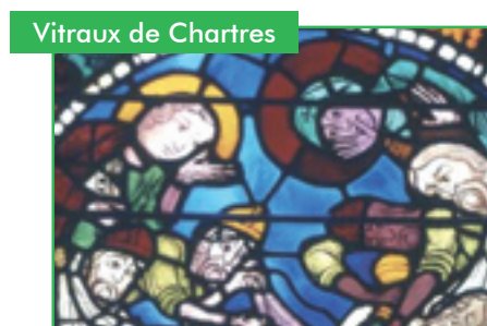
Vitraux de Chartres