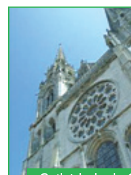
Cathédrale de Chartres