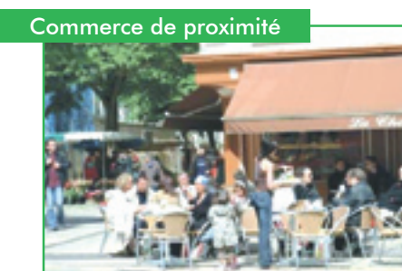
Commerce de proximité