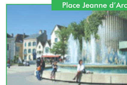
Place Jeanne d'Arc